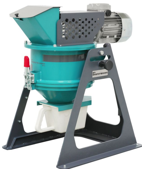
Рис. 1. Истиратель почвы ИП 1