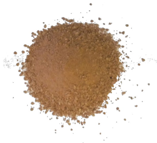
Рис. 4. Продукт измельчения