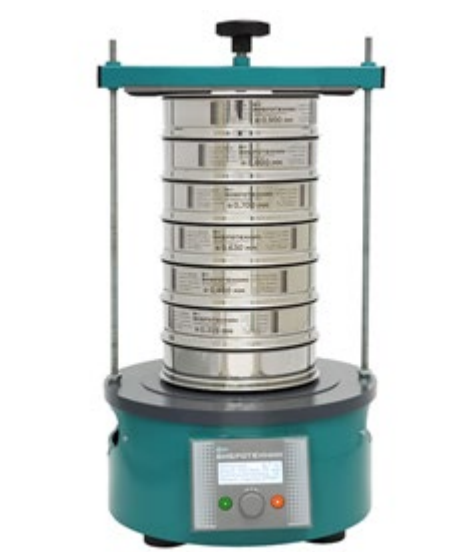
Рис. 2. Анализатор А 20 на базе Вибропривода ВПС