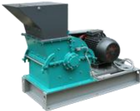
Рис 1. Молотковая дробилка МД 5х5