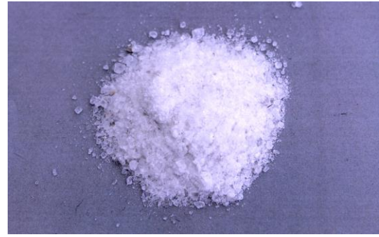
Рис.4. Продукт дробления