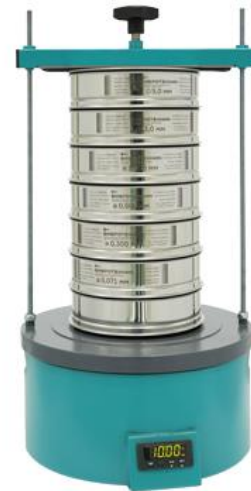
Рис 2. Анализатор А 20