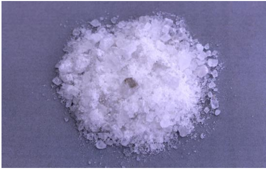
Рис.3. Материал до дробления