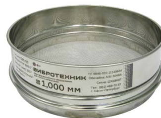
Рис. 3 Сито лабораторное С20/50