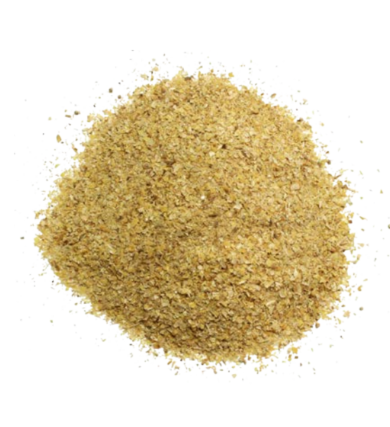
Рис. 5. Продукт измельчения