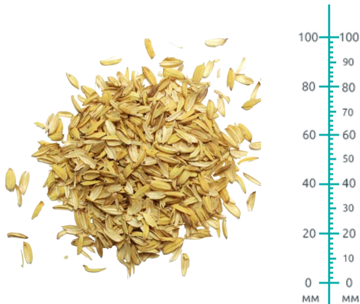
Рис. 4. Материал до измельчения