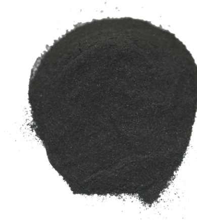
Рис.3. Материал до измельчения