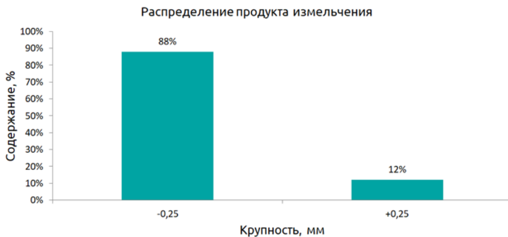
Рис. 5. Распределение продукта измельчения.