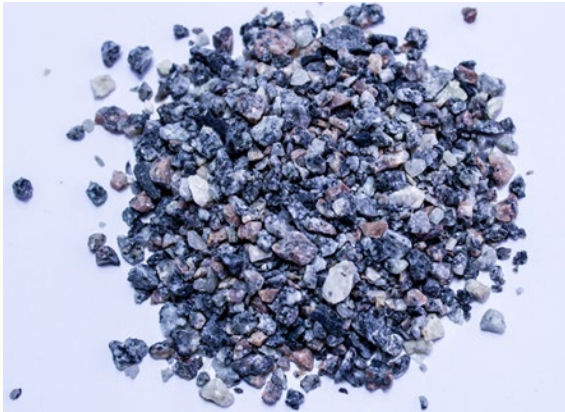
Рис.3. Материал до измельчения