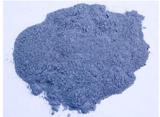
Рис.4. Продукт измельчения