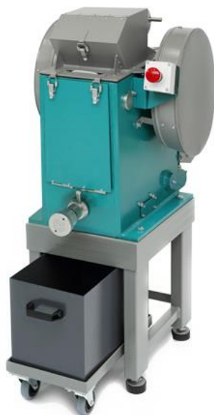
Рис. 1. Щековая дробилка ЩД 10М на опоре