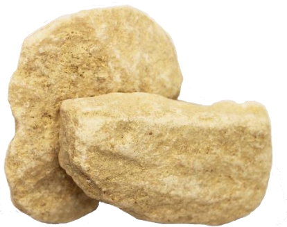
Рис. 3. Материал до дробления