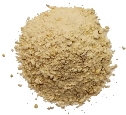
Рис. 4. Продукт дробления