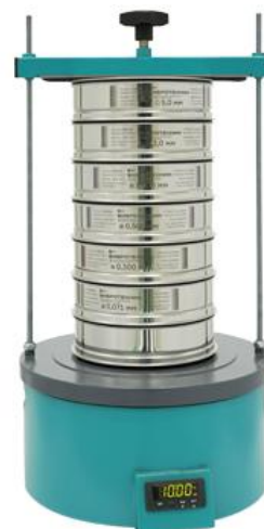
Рис. 2. Анализатор А 20