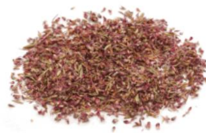
Рис. 4. Продукт измельчения.