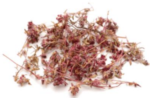
Рис. 3. Материал до измельчения.