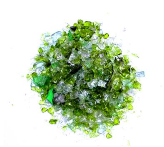
Рис.4. Продукт дробления