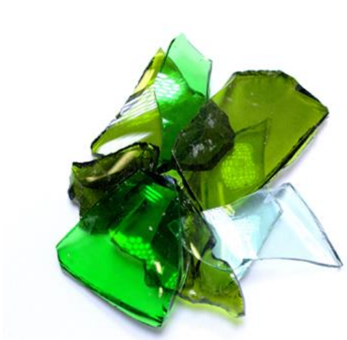
Рис.3. Материал до дробления