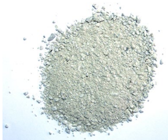
Рис. 4. Продукт дробления