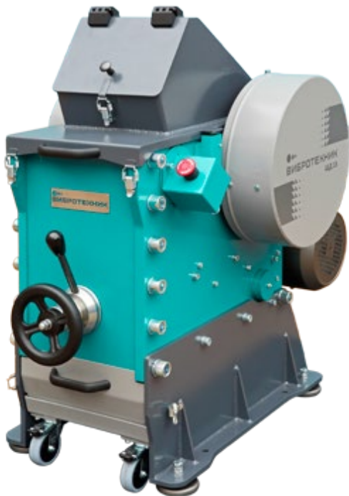
Рис. 1. Щековая дробилка ЩД 15