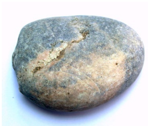
Рис. 3. Материал до дробления