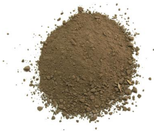
Рис. 4. Материал до измельчения