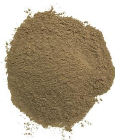
Рис. 5. Продукт измельчения