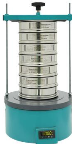
Рис. 2. Анализатор А 20