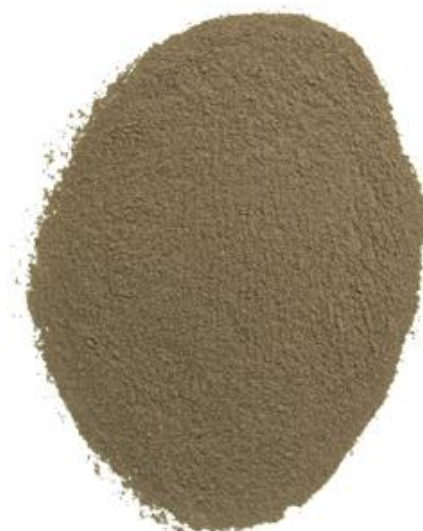
Рис. 5. Продукт измельчения