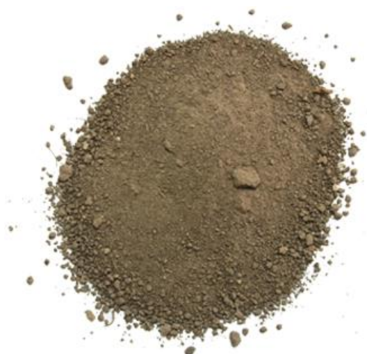
Рис. 4. Материал до измельчения