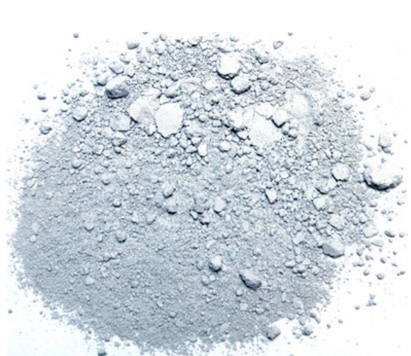
Рис. 5. Продукт измельчения