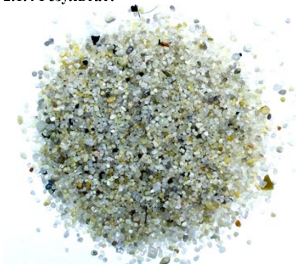
Рис. 4. Материал до измельчения