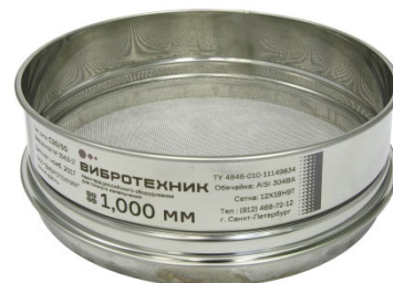
Рис. 3. Сито С20/50