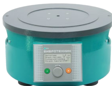
Рис. 2. Вибропривод ВПС