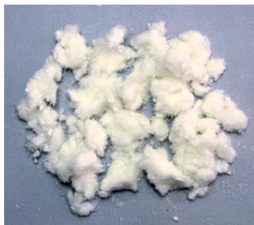
Рис. 3. Продукт измельчения