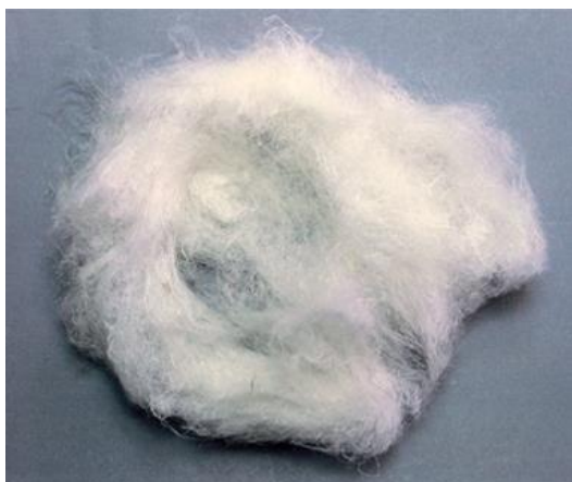
Рис. 2. Материал до измельчения

2.1.4 Результат: Из-за волокнистой структуры материала оценить гранулометрический состав продукта измельчения не представляется возможным. Размер продукта измельчения оценивался визуально и составил от 2 до 6 мм.