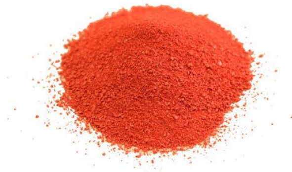
Рис.3. Материал до дробления