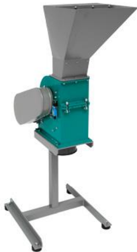
Рис 1. Молотковая дробилка МД 2х2