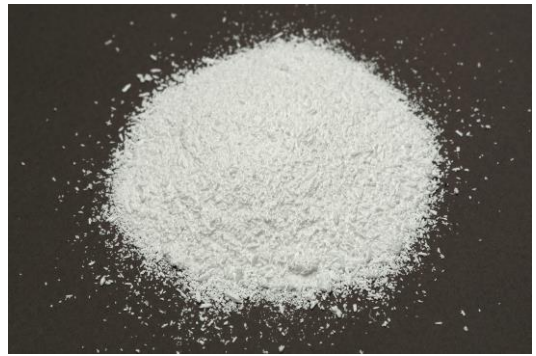
Рис.4. Продукт измельчения