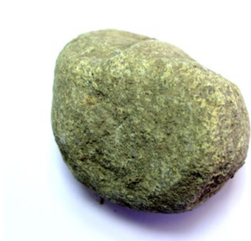
Рис. 3. Материал до дробления