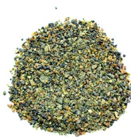
Рис. 4. Продукт дробления