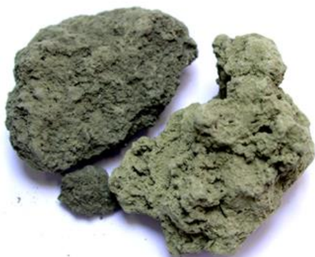
Рис.3. Материал до дробления