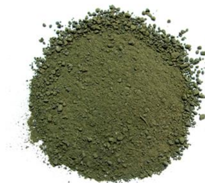
Рис.4. Продукт дробления