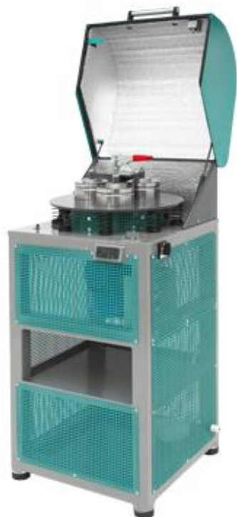
Рис. 1. Истиратель вибрационный ИВ 3