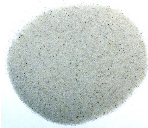
Рис. 4. Материал до измельчения