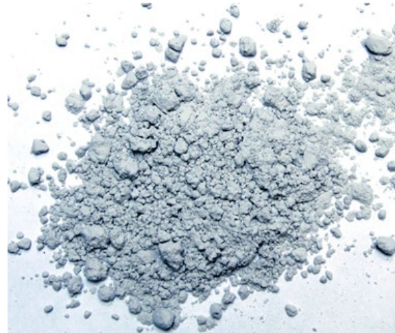
Рис. 5. Продукт измельчения