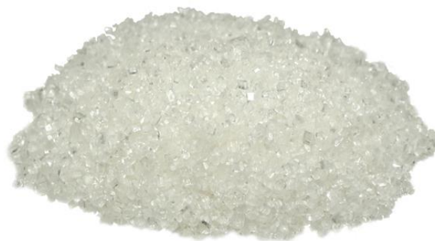
Рис.4. Продукт дробления