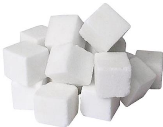
Рис.3. Материал до дробления