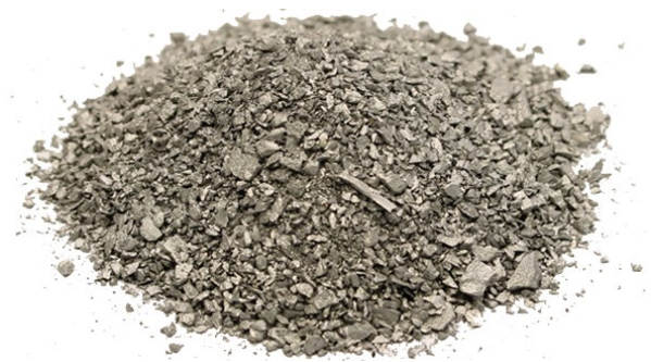
Рис. 4. Продукт дробления