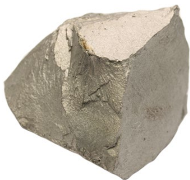
Рис. 3. Материал до дробления