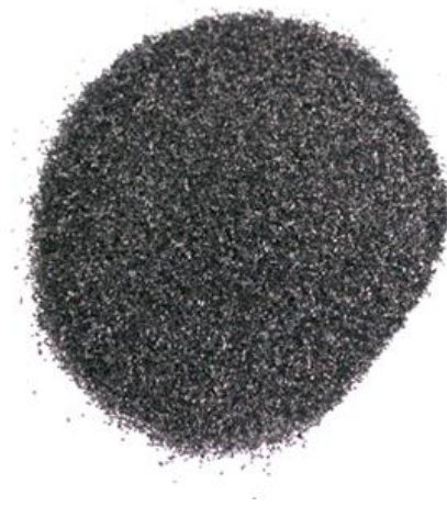
Рис.4. Продукт измельчения