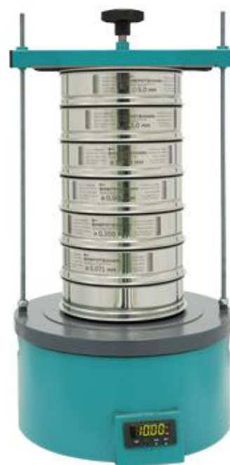
Рис. 2. Анализатор А 20