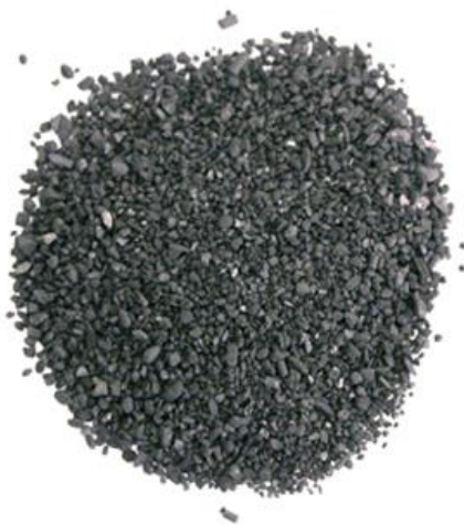
Рис.3. Материал до измельчения