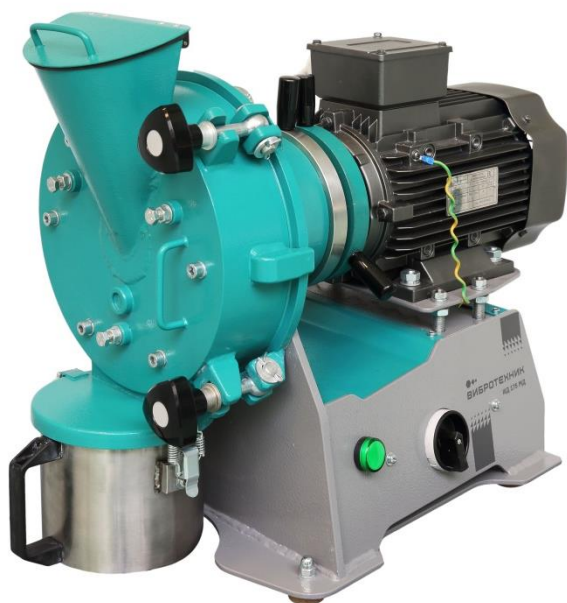
Рис. 1. Истиратель дисковый ИД 175М