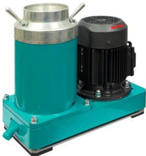
Рис 1. Вибрационная конусная мельница дробилка ВКМД 6