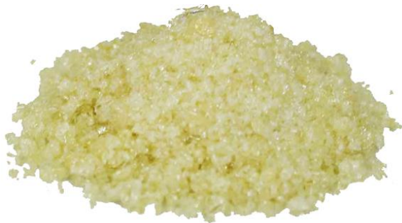
Рис.3. Материал до измельчения