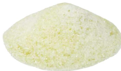
Рис.4. Продукт измельчения