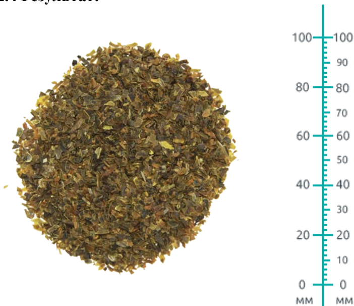
Рис. 2. Материал до измельчения