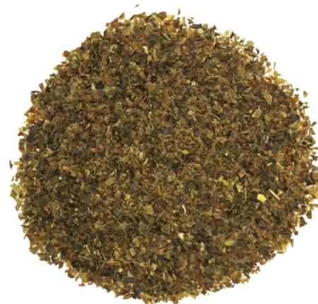
Рис. 3. Продукт измельчения