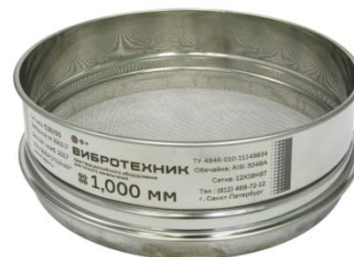
Рис. 3 Сито лабораторное С20/50