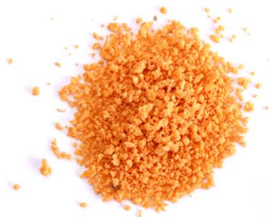
Рис. 4. Продукт измельчения