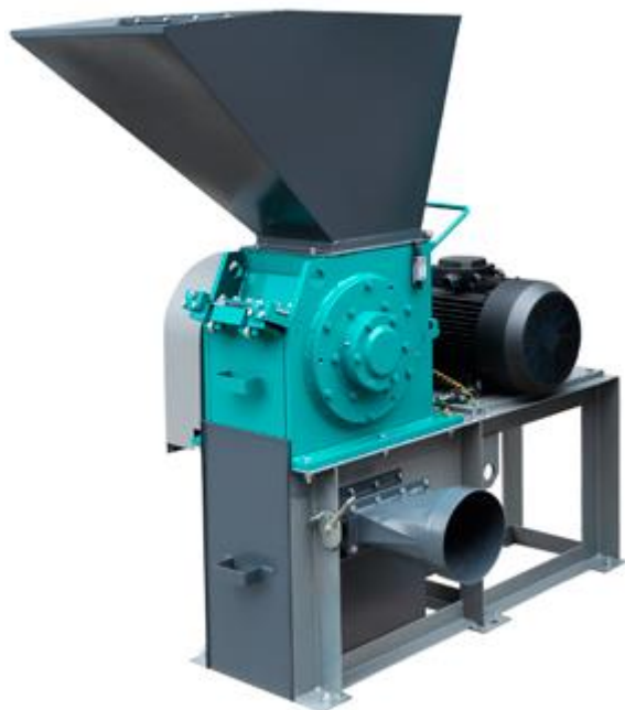
Рис. 1. Роторная ножевая мельница РМ 250