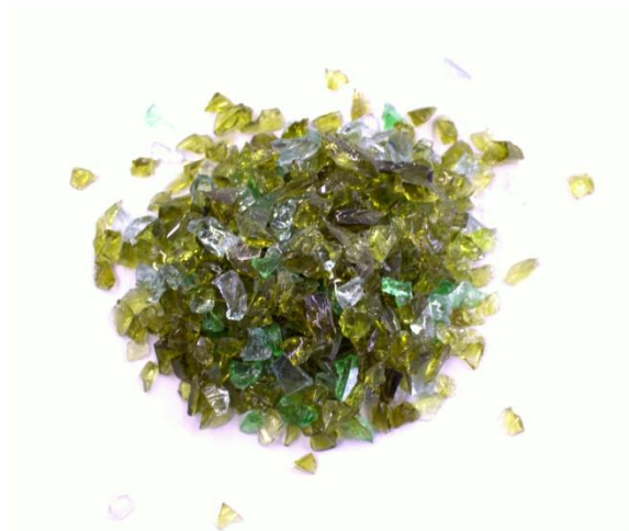
Рис.3. Материал до дробления