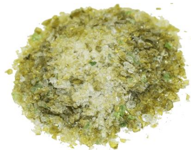
Рис.4. Готовый продукт