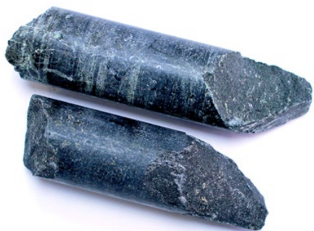
Рис. 3. Материал до дробления