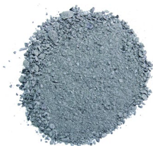
Рис. 4. Продукт дробления