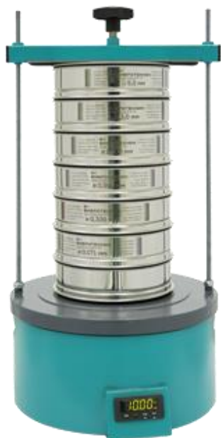
Рис. 1. Анализатор ситовой А 20

1.3 Поставленная задача: Сравнение эффективности отсева с применением активаторов отсева и без применения.