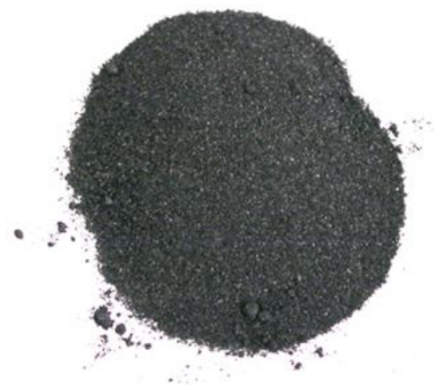
Рис.4. Продукт измельчения