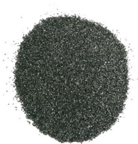
Рис.3. Материал до измельчения