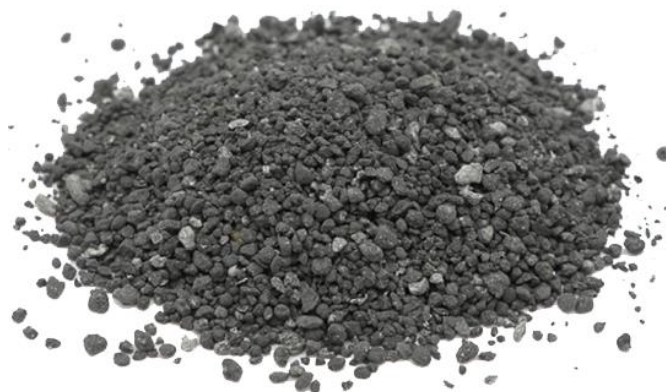
Рис. 5. Продукт дробления