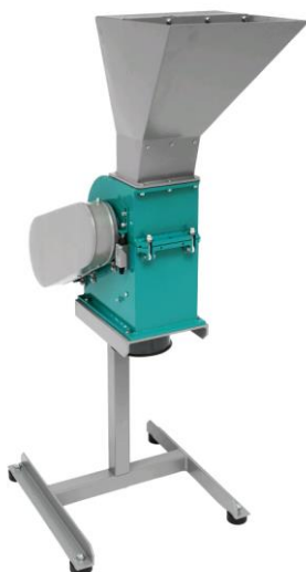
Рис. 1. Молотковая дробилка МД 2х2