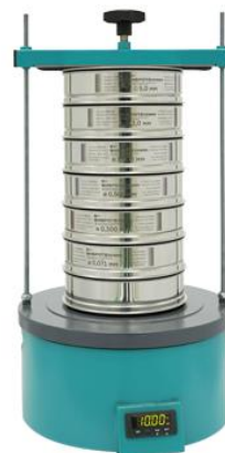
Рис. 3 Анализатор А 20