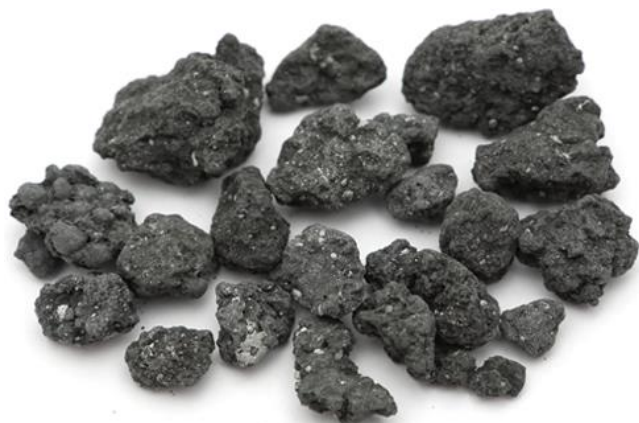
Рис. 4. Материал до дробления