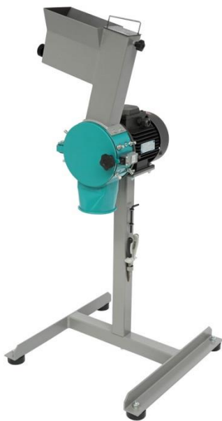
Рис. 1. Роторная ножевая мельница РМ 120