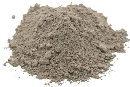
Рис.4. Продукт измельчения