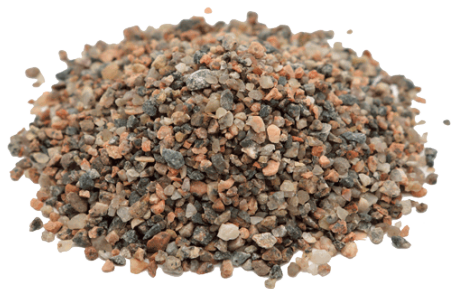
Рис.3. Материал до измельчения