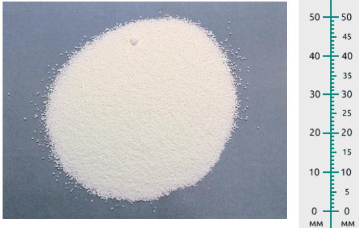
Рис. 2. Продукт отсева