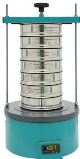
Рис. 1. Анализатор А 20