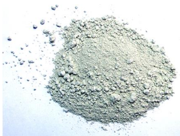
Рис. 4. Продукт измельчения