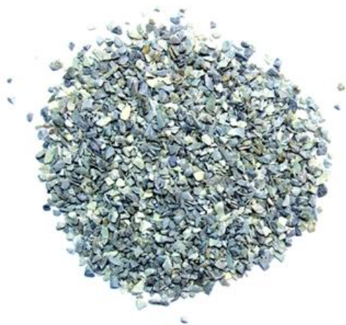
Рис. 3. Материал до измельчения