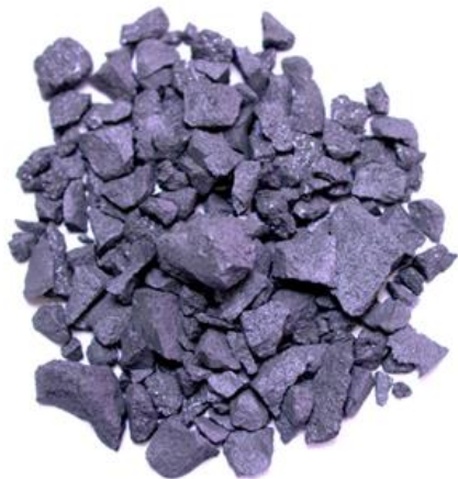
Рис.3. Материал до измельчения