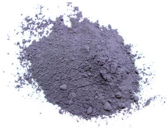
Рис.4. Продукт измельчения