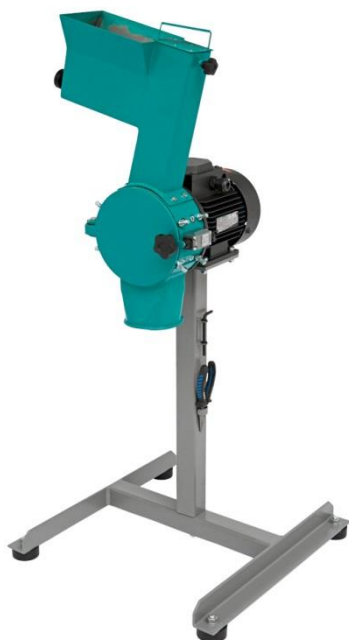
Рис 1. Роторная ножевая мельница РМ 120