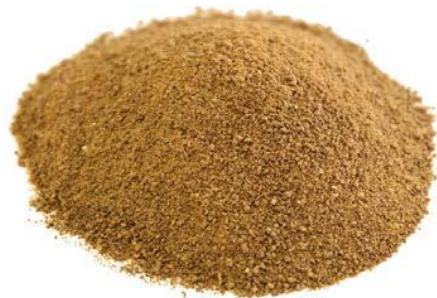
Рис.4. Продукт измельчения