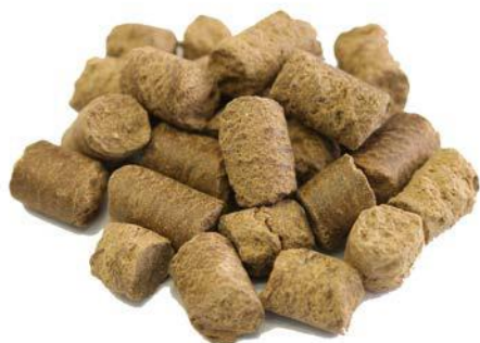
Рис.3. Материал до измельчения