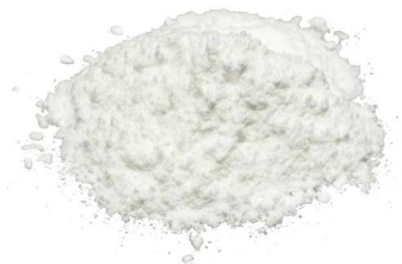
Рис.3. Материал до измельчения