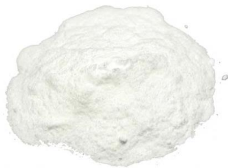
Рис.4. Продукт измельчения