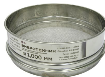
Рис. 3. Сито С20/50