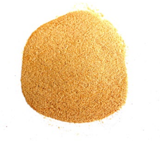
Рис.5. Продукт измельчения