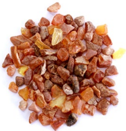
Рис.4. Материал до измельчения