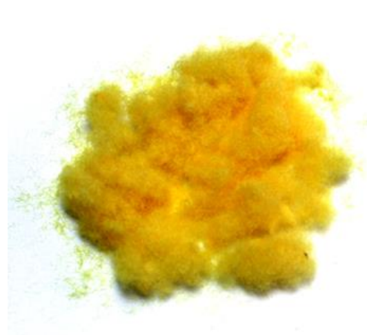
Рис.3. Продукт измельчения