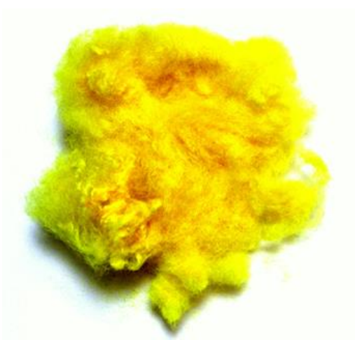
Рис.2. Материал до измельчения