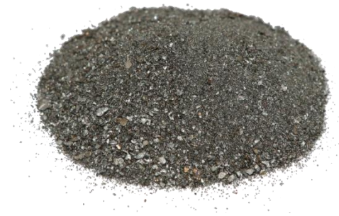
Рис. 3. Материал до измельчения.