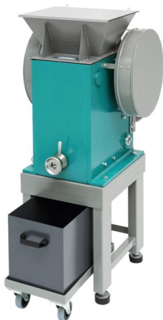
Рис. 1 Щековая дробилка ЩД 10.