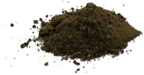
Рис.4. Продукт дробления