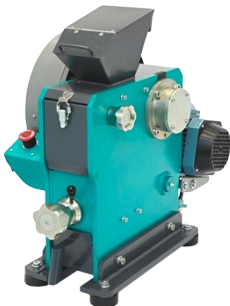
Рис. 1. Щековая дробилка ЩД 6М