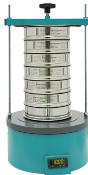
Рис. 2. Анализатор А 20