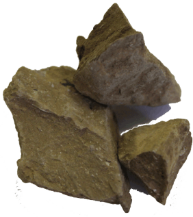
Рис.3. Материал до дробления