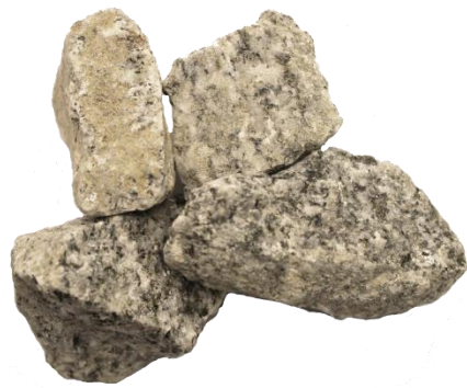
Рис. 3. Материал до дробления