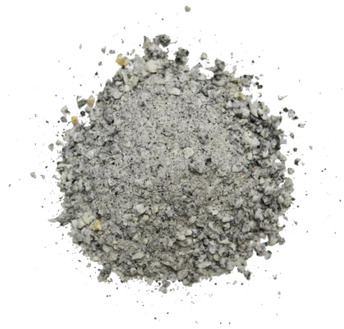
Рис. 4. Продукт дробления