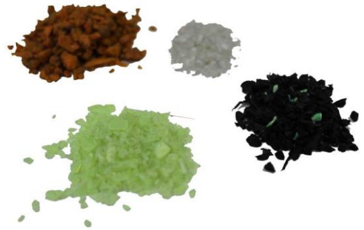
Рис. 4. Продукт измельчения