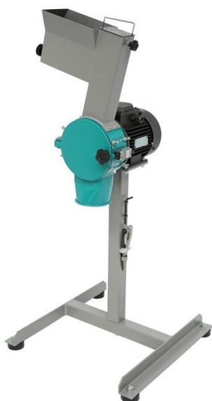
Рис. 1. Мельница ножевая РМ 120