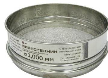
Рис. 3. Сито С20/50