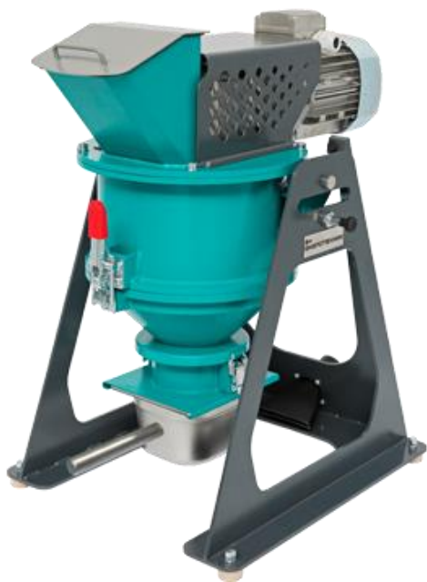
Рис 1. Истиратель почвы ИП 1