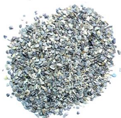
Рис. 3. Материал до измельчения