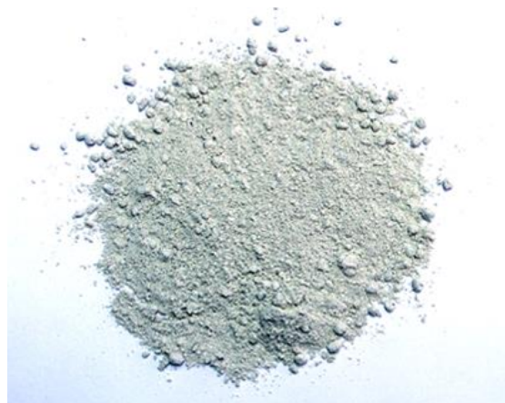
Рис. 4. Продукт измельчения