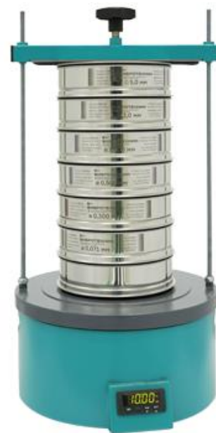
Рис. 2. Анализатор А 20