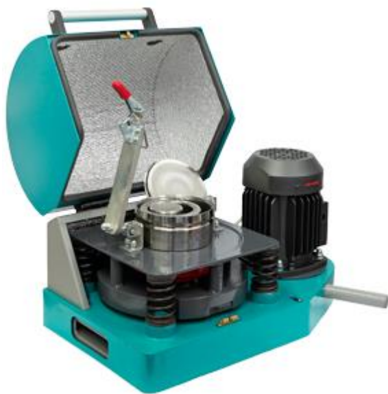
Рис. 1. Истиратель вибрационный ИВ 1