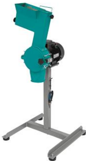
Рис. 1. Роторная ножевая мельница РМ 120