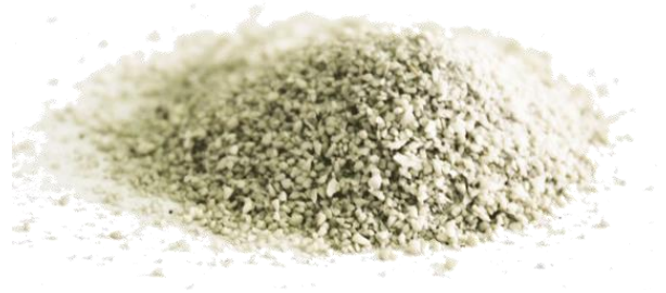
Рис.4. Продукт измельчения