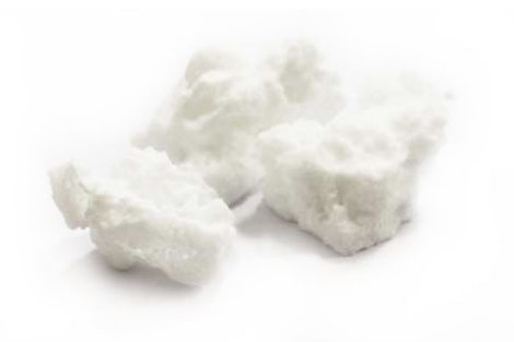
Рис. 3. Материал до дробления