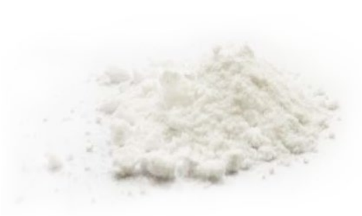
Рис. 4. Продукт дробления